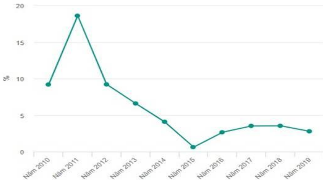
Lạm phát Việt Nam, giai đoạn 2010-2019

Trong bối cảnh nền kinh tế tăng trưởng mạnh mẽ, lạm phát năm 2019 chỉ đạt 2,73%. Như vậy lạm phát năm 2019 thấp nhất trong 3 năm gần đây khi năm 2018 là 3,54% và năm 2017 là 3,53%. Lạm phát duy trì ở mức thấp tiếp tục tạo cơ hội cho Ngân hàng Nhà nước thực hiện các chính sách nới lỏng tiền tệ linh hoạt và hiệu quả hơn.